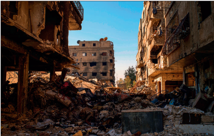
Разрушенный боевиками ИГИЛ Дамаск.

Террористы поставили на поток производство видеороликов с жестокими сценами казней пленников, заложников и «вероотступников». Эти материалы потом широко распространяются в социальных сетях и