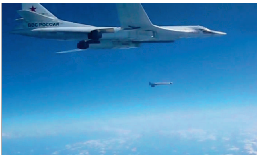
Воздушная операция российских ВКС по уничтожению боевиков ИГИЛ в Сирии.