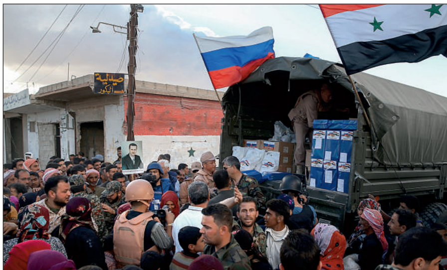
Россия оказывает гуманитарную помощь Сирии.