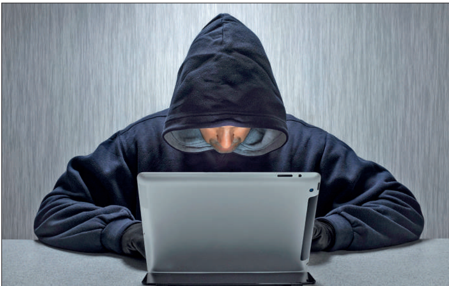
Вербовщики ИГИЛ активно используют Интернет.

Террористы день ото дня совершенствуют методы вербовки новых сторонников, а также алгоритмы их идеологической обработки. Читателю стоит помнить, что те типовые ситуации, которые описаны в данном пособии, можно рассматривать лишь в качестве базовых ориентиров,