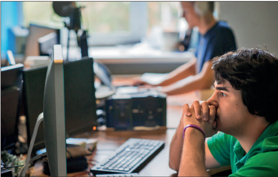
Постоянное присутствие вербовщиков ИГИЛ в соцсетях.

Активисты ИГИЛ поддерживают свои аккаунты в сетях Facebook, Twitter, Instagram, Friendica, Telegram. Активно они заявили о себе и в российских социальных сетях: «ВКонтакте» и «Одноклассниках».