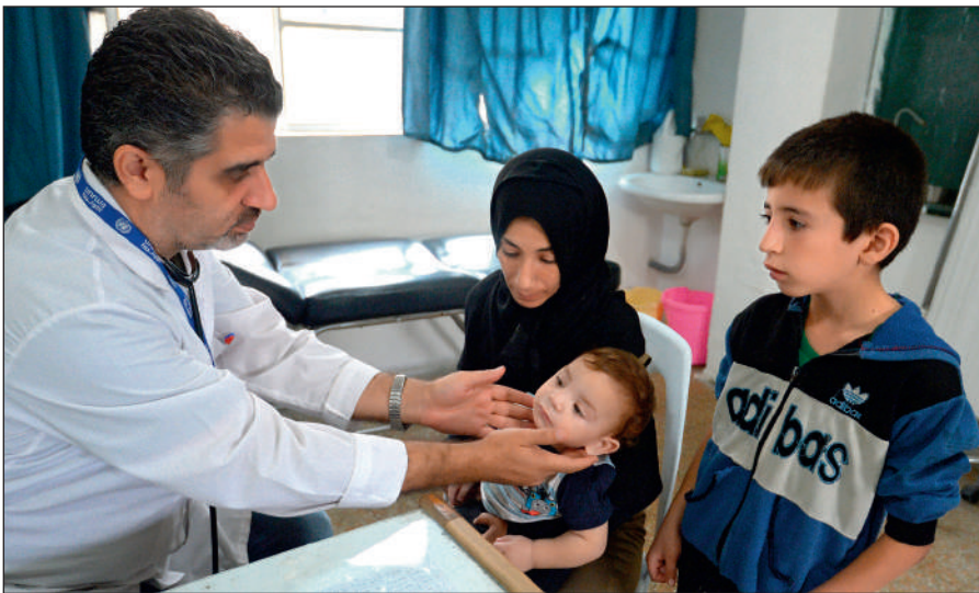
Истинный ислам призывает к состраданию и милосердию. Врач осматривает ребенка в медицинском пункте лагеря при одной из школ Дамаска.

Радикалы объявляют «врагами ислама» всех несогласных с ними мусульман. Ультрарадикальные группировки признают террор и насилие единственным способом достижения провозглашенных ими целей.