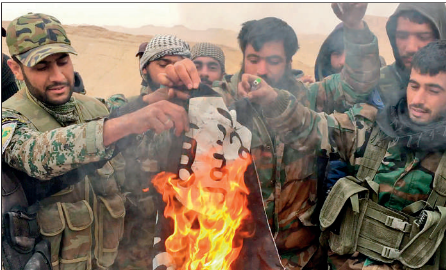
Народные ополченцы САР сжигают флаг ИГИЛ, снятый с отбитой у боевиков цитадели Пальмира.

Современное государство обязано защищать интересы каждого своего гражданина вне зависимости от его расы, национальности, принадлежности к определенной конфессии или религиозной традиции, в то время как ИГИЛ выражает интересы небольшой группы религиозных радикалов, жестоко подавляя остальную часть населения посредством запугивания, насилия и террора.